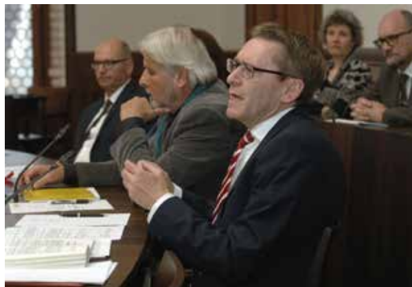
Regierungsrat und Finanzdirektor Roland Heim.