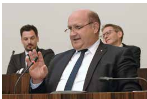
Peter Hodel, Regierungsrat

Zusammenarbeit mit den Personalverbänden vornehmen. Und schliesslich sind sich Regierungsrat und Personalverbände einig, dass die Information der Mitarbeitenden und der Öffentlichkeit über die Arbeit der Gesamtarbeitsvertragskommission (GAVKO) verbessert werden müsse. Regierungsrat Hodel bedankt sich abschliessend für die gute Arbeit aller Mitarbeitenden des Kantons.