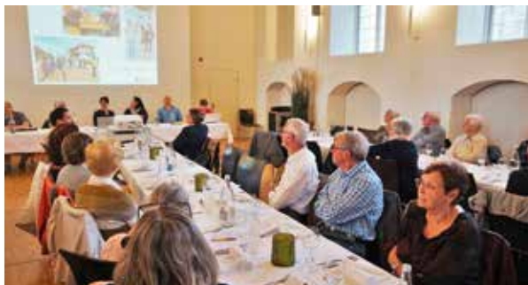
Impressionen des Abends.