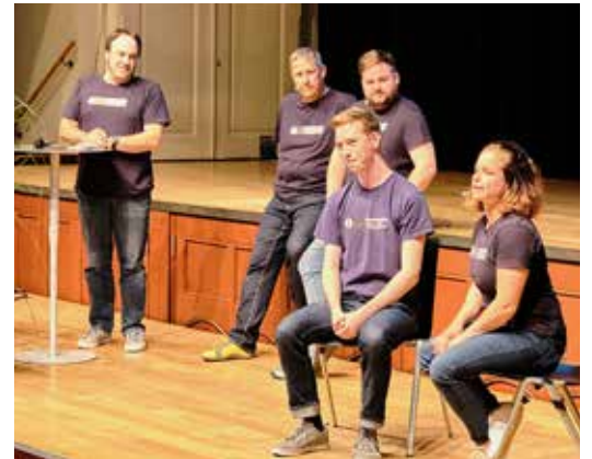
Kultureller Akzent mit der Gruppe improVISION