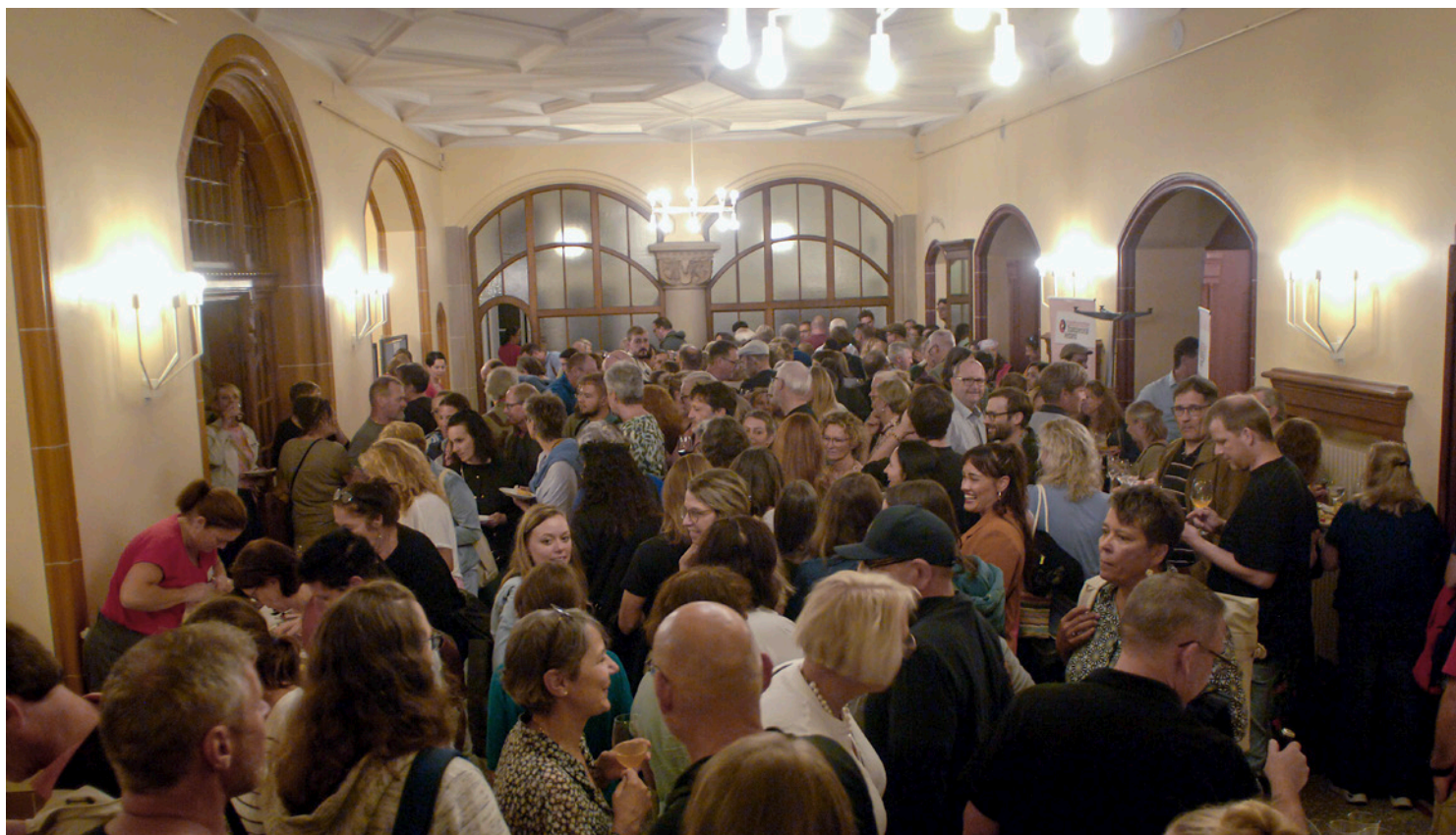
Der Angestelltentag wird auch in diesem Jahr – wie schon in den letzten Jahren – ein Gradmesser für die Stimmung der Mitarbeitenden sein.

Es wäre eine Illusion zu glauben, die Parlamentarierinnen und Parlamentarier würden sich aus eigenem Antrieb wirklich für gute Arbeitsbedingungen für die Mitarbeitenden im Kanton Solothurn einsetzen. Die letzten Jahre haben gezeigt, dass der Druck auf das Personal gestiegen ist – sei es durch die 1:85-Initiative oder den Massnahmenplan 2024. Der Regierung, dem Parlament und der Spitalleitung waren die Finanzen wichtiger als die Arbeitsbedingungen und die Wertschätzung der Mitarbeitenden. Wir müssen verhindern, dass man in der Politik und auf der Arbeitgeberseite